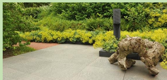
Noviton 60x60 cm Lagos >

Bij levering van meerdere pakketten tegels dient u de pakketten te mengen om zo een optimale kleurschakering te verkrijgen. Tegels kunt u met een rubber hamer inkloppen in het zandbed.