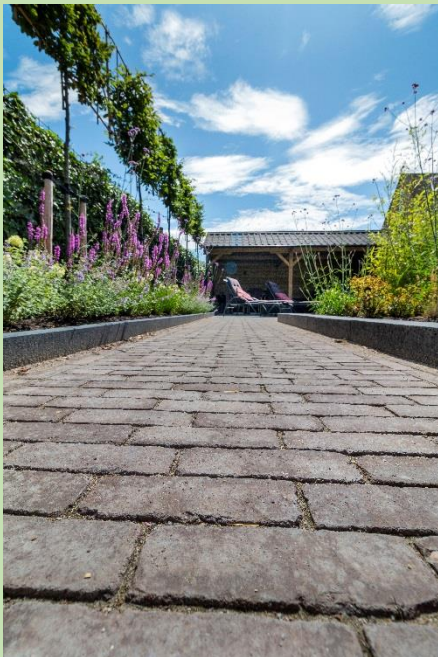
➤ Pesaro bruin blauw onbezand DF getrommeld

Nieuwenhuis Buitenleven wenst u veel plezier met uw bestrating.